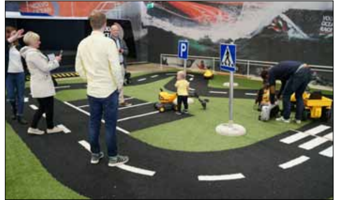
Trafikskola, det skall börjas i tid