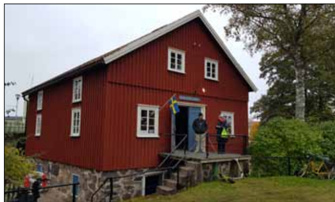
Kerstinsås kvarn med huvudingången från lastbryggan