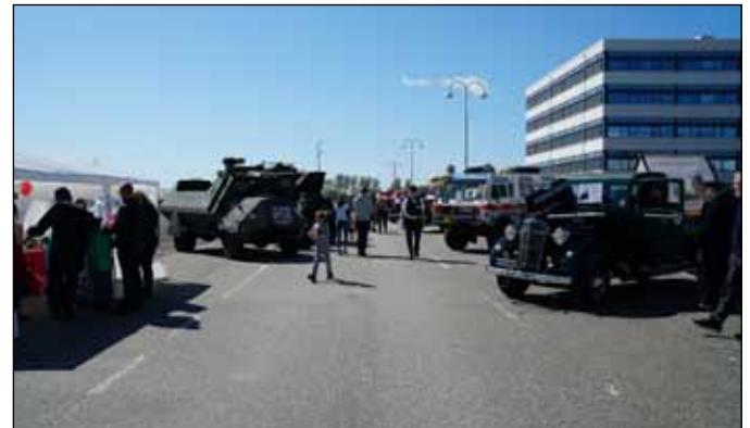
Veteranfordon, främst i bild en Chevrolet lastbil från 1937