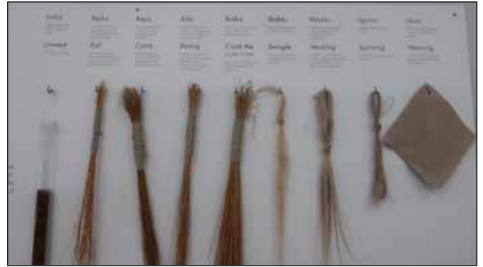
Från frö till färdig väv.