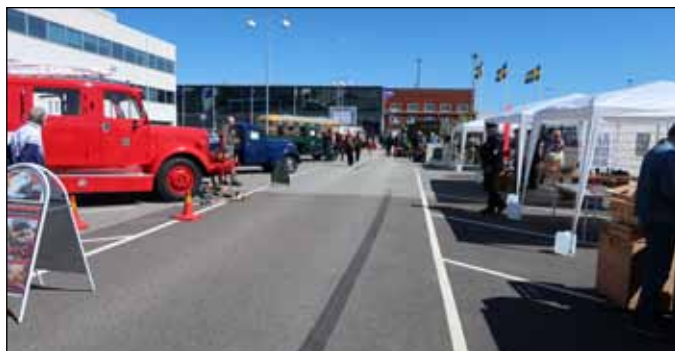
En lång rad av utställare i tält och fordon

Besökarna kunde vandra runt bland NAVs olika utställare, både inomhus och utomhus, eller ta en titt på alla utställda bilar och annat som finns på museet.