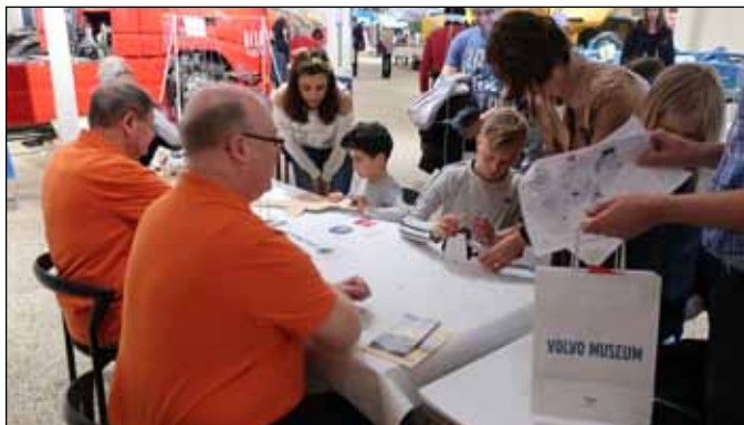
Små bilbyggare i Volvo Museums egen monter

Det gick naturligtvis även att bygga en liten Volvobil. Belöningen efter avslutad skattjakt blev en stor guldpeng.