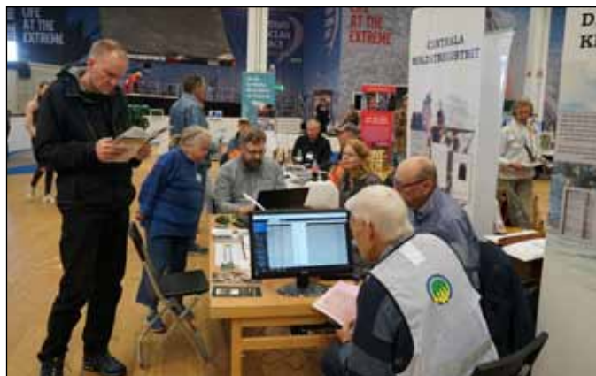
Garnisonsmuseet Skarborg med sitt soldatregister