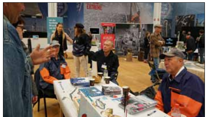
Fiskemuseet Hönö informerar några besökare