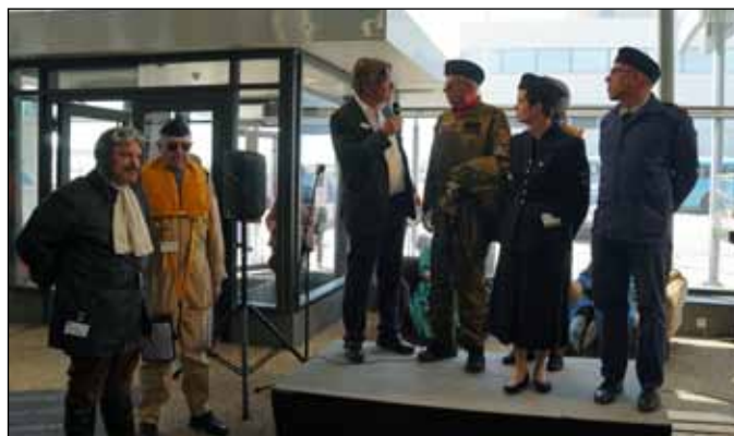
Aeroseum med representanter från flera olika yrken