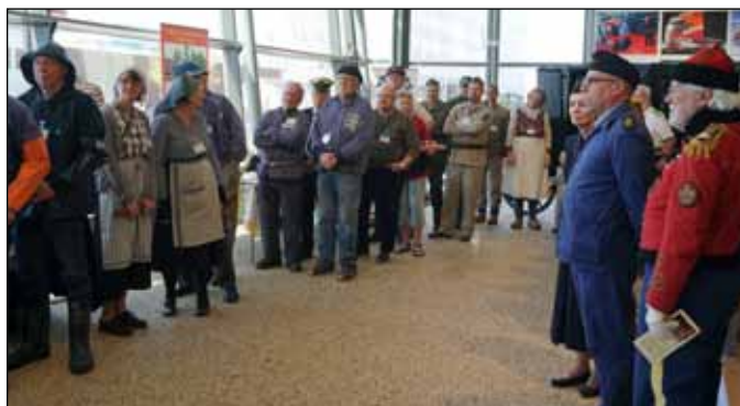
Kö till till intervjudodiet för presentationen av alla yrken