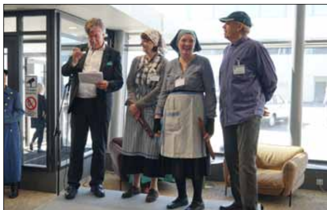
Göteborgs Remfabrik representerade 3 textila yrken