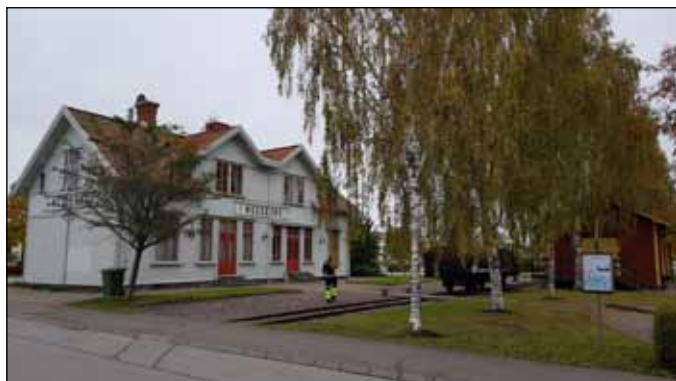
Järnvägsmuseet med stationsområdet från spårvidan

Stationshuset är idag ett järnvägsmuseum, med mängder av foton och föremål från järnvägsepoken. Stationshusets vackra lägenhet visas på andra våningen. I museet finns idag även föremål och berättelser från Necks verkstäder, som var en stor och viktig verkstadsindustri i Nossebro. Öppettider till järnvägsmuseet finns på den egna hemsidan.