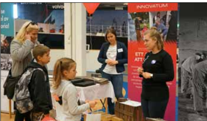
Skattjakt vid Innovatums monter

Skattjakten för barn och föräldrar med besök på 10 olika stationer var ett uppskattat inslag. Många gladdes av att se barnens (och ibland föräldrarnas) intresse av att "pröva på" olika arbetsuppgifter hos utställarna och få en stämpel på skattjaktskartan. Uppgifterna varierade från att mala mjöl till att blåsa upp en ballong eller svara på en fråga.