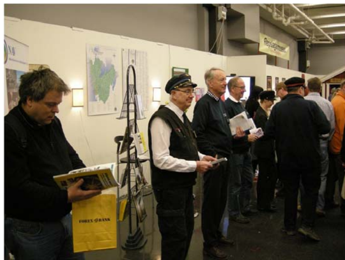
Stort Tack till alla som medverkade.

Vissa av våra medlemmar använde den nya vita snabbt framtagna tröjan, andra hade sina uniformer.