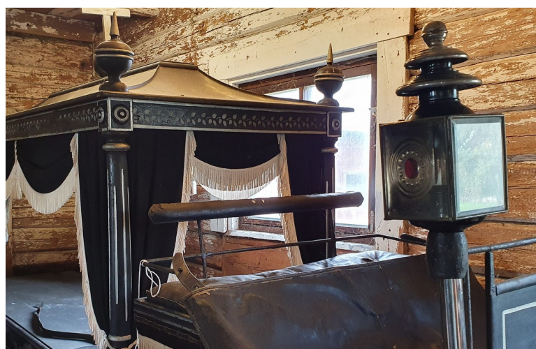
Randning av hjul och detaljer på en likvagn.

- Man kan använda vilken färg som helst, men det gäller att ha rätt konsistens. Det sägs att den ska vara som lätt vispad grädde. För att slippa att det rinner ut används ofta emaljfärg som inte rinner och torkar snabbt.