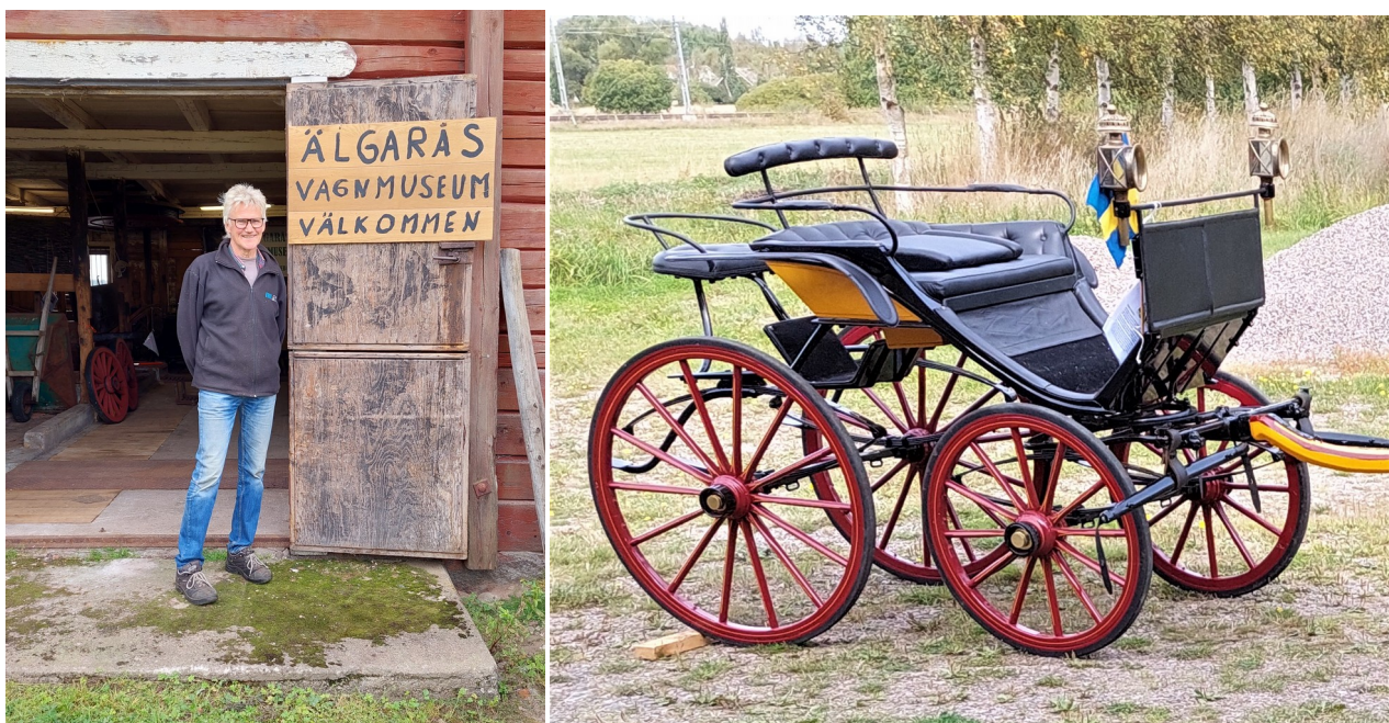
Lasse Hellsten driver Älgårås vagnmuseum med 260 ekipage i samlingen.