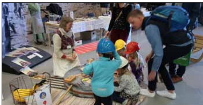
Barn och familjer är en viktig grupp för att få fler framtida besökare på våra museer i länet.

Representanter för de olika parterna träffas med vissa mellanrum för att tillsammans dra upp riktlinjerna. Senaste mötet var den 5 februari. Nästa träff kommer i början på mars månad.