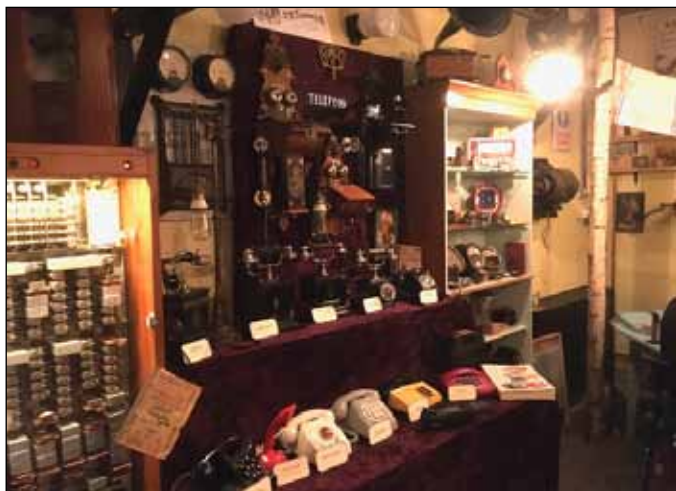
Bland drygt 2000 föremål finns en imponerande samling telefoner.

En av NAVs senaste medlemmar är Vänföreningen Nilssons El- & Teknikmuseum i Lerum.