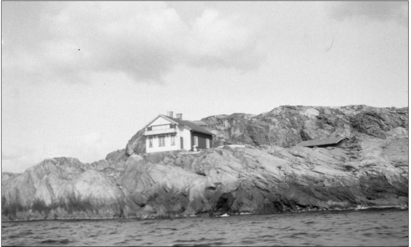
Islandsbergs fyrplats, längst ut på Skaftö i mellersta Bohuslän, ligger vid en av kustens mest utsatta passager. Det kombinerade fyr- och bostadshuset från 1883 ersattes 1938 av en automatisk fyr.

Dagtid vidtog underhållsarbeten på fyren, byggnader, båtar och bryggor. När lotskaptenen ankrade upp vid fyren gällde det att hissa flaggan och ta på sig tjänsteuniformen. En inspektion vidtog där allt betygsattes, från fyrens beskaffenhet till poleringen av zinkdiskbänken i köken.