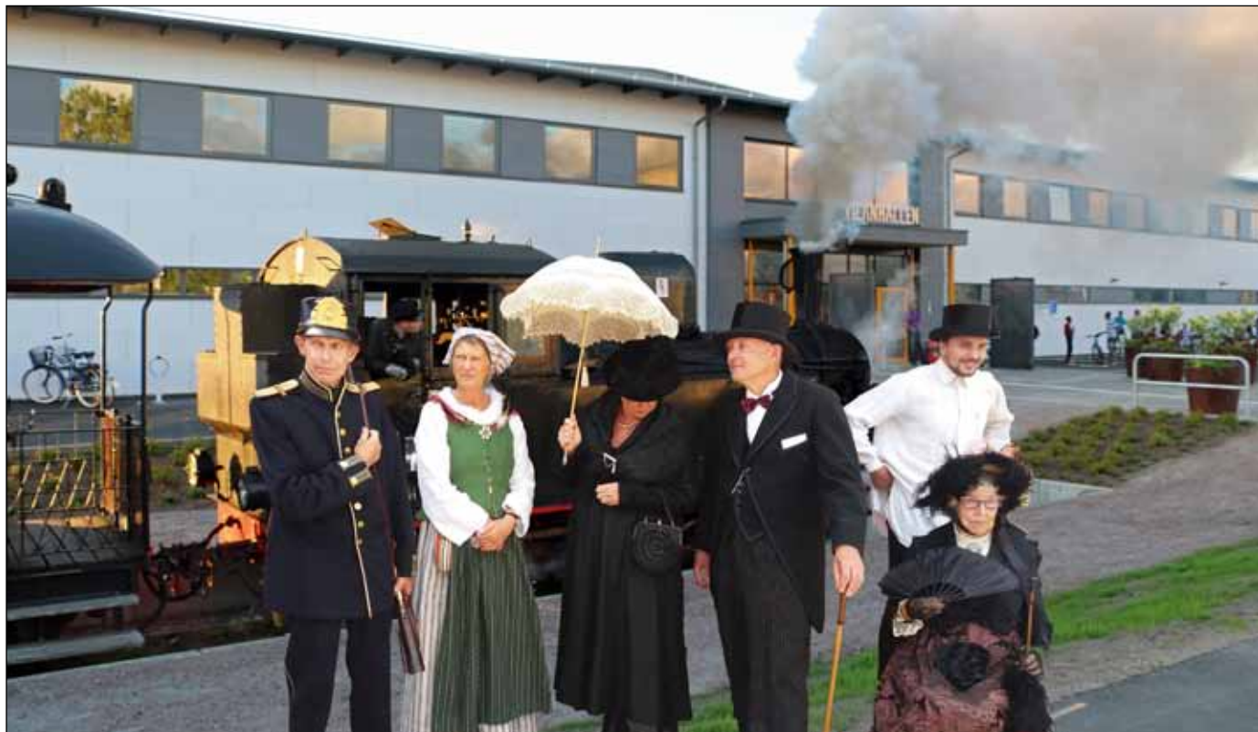
De första gästerna anländer till Arbetslivsmuseernas Dag kl. 11, för att under dagen delta i många av de trevliga aktiviteter som alla utställare bjuder på inomhus och utomhus framför Vilanhallen- Fotot: är redigerat för att ge en bild av hur det kan se ut på Vilanområdet 25 april 2020.