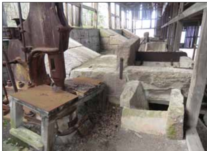
En av stenklyvningsmaskinerna som producerade gatsten, s.k. knott.

Knott kallas den mindre gatsten som kom att användas på gator och landsvägar för 100 år sedan. Gatsten hade länge huggits för hand när man i början av 1900-talet började tillverka maskiner för detta ändamål.