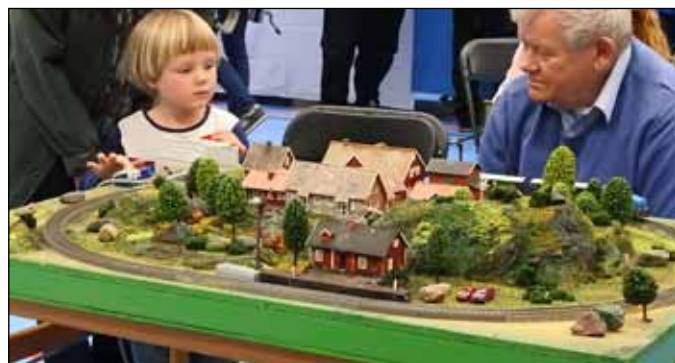
Spår & Tåg i Väst, en av många anmälda utställare som kommer till Skara med sina modelltågbanor för barn och vuxna.

Arbetslivsmuseernas Dag i Skara, vi uppmanar er att utnyttja denna dag och möjlighet att visa upp ert besöksmål, träffa kollegor, utbyta erfarenheter och bli inspirerad till ert fortsatta ideella arbete. Forts. sidan 4