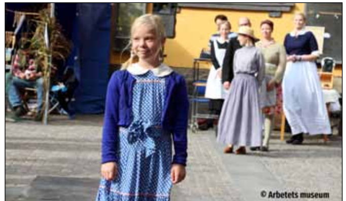
Även uppmärksammades att det fanns barnarbete på fabrikerna