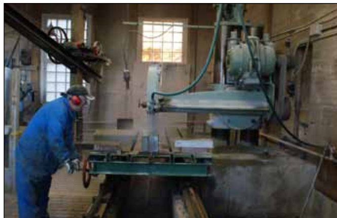
1936 öppnades den nya verkstaden och vissa dagar körs maskinerna så att besökarna får se hur det går till. Vattnet som sprutas i sågen är viktigt för processen.

Bakom utmärkelsen, Årets Arbetslivsmuseum står Arbetets museum i samverkan med Arbetslivsmuseernas Samarbetsråd, Statens försvarshistoriska museer, Statens maritima museer och Sveriges Järnvägsmuseum. Priset består av 25 000 kr, en emaljskylt samt äran.