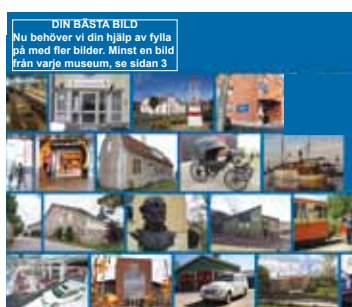
Sista sidan; visar mångfalden med bilder från flera arbetslivsmuseer i Västra Götaland. Nu behöver vi bilder från alla arbetslivsmuseer; läs mer på sidan 3