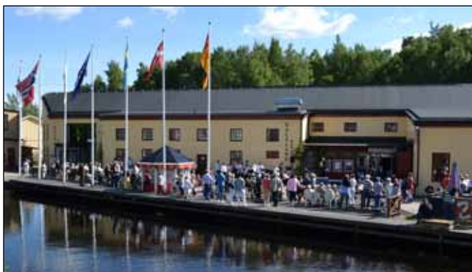
Nationaldagsfirande vid Dalsland Center.

När pappersbruket i Håverud stängde i början på 70-talet blev lokalerna tomma. Några år senare öppnade Dalsland Center med en utställning över de dalsländska företagen. Idag är det ett Visitor Center med turistbyrå, utställningar, glashytta, butiker, restauranger och caféer. Dalsland Center besöks årligen av över 100 000 personer. Det är i denna anrika miljö, som är fylld av industrihistoria,