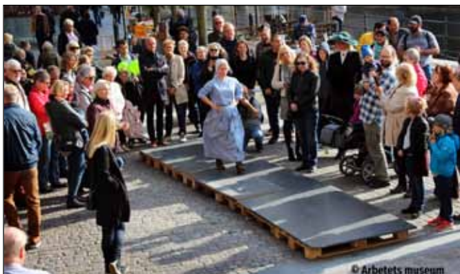
Modevisning vid 3 tillfällen under dagen, med kläderna och yrken du minns – eller kanske har glömt bort?