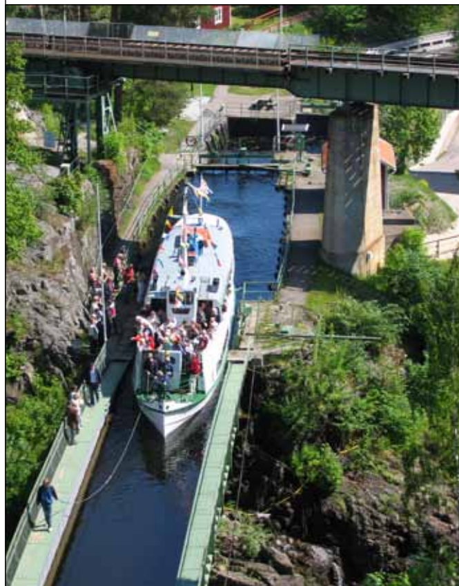
Kanalbåten M/S Storholmen i Akvedukten.

Vi samarbetar med Innovatum, Västarvet samt hembygdsförbunden och Maritimt i Väst, i år finns även ett lokalt samarbete med Dalslands Center/Melleruds kommun. En av höjdpunkterna i år kommer ju att vara besök av ett flertal äldre båtar som skall samsas med ångtåg och veteranfordon. Vi kommer även att bjuda in flygande farkoster, så alla kan mötas på samma plats.