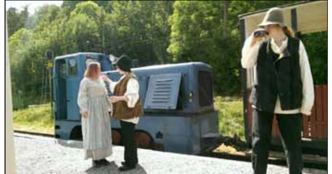
Perrongteater i Munkedal sommaren 2017.