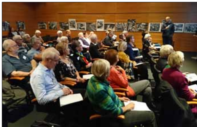
En bild från Samverkansdagen med en lyssnande publik

Här framkom ett antal planerade aktiviteter där samverkan är av stor betydelse.