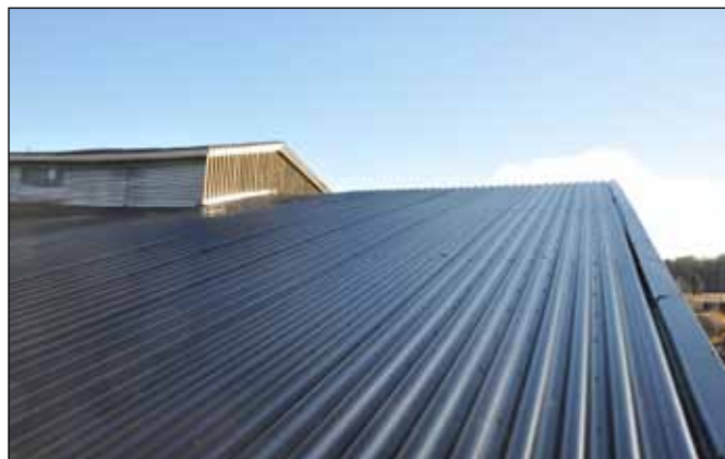
I en serie bilder som beskriver reparationen av lokstallstaket i Åmål, ser vi Anders Svensson och Lennart Svensson.