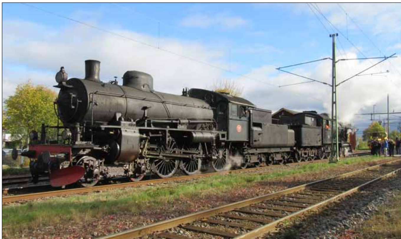
De båda ångloken rangeras på Grästorps station 17 september 2017.

1868 var järnvägen mellan Herrljunga och Uddevalla färdigbyggd. Herrljunga ligger vid Västra stambanan mellan Stockholm och Göteborg och Uddevalla har en hamn vid västerhavet. Banan blev därmed en viktig förbindelse för transport av lantbruksprodukter där exporten av havre länge var betydelsefull. Havre var drivmedlet för hästdragna transporter.