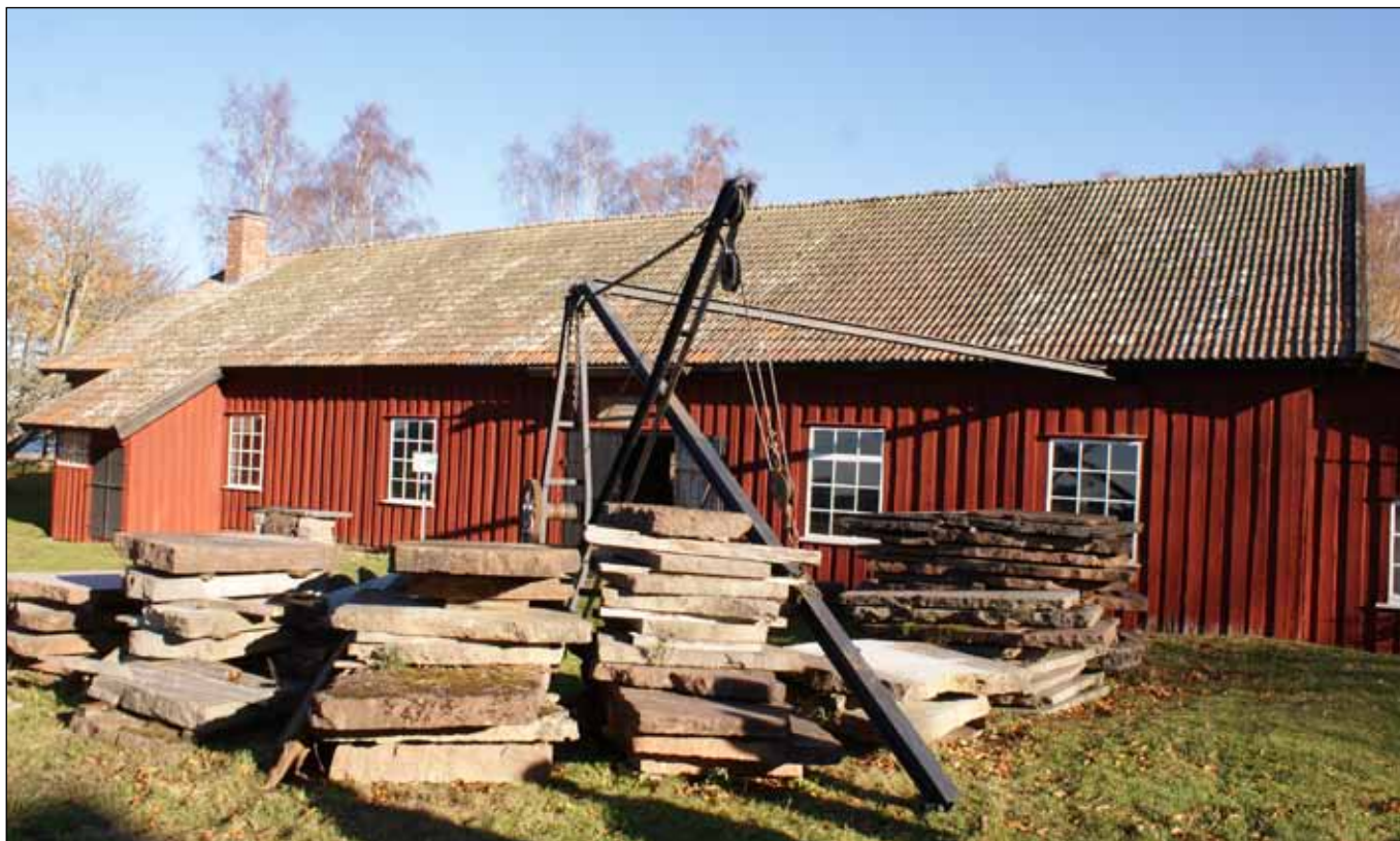
Råbäcks Mekaniska Stenhuggeri är Årets Arbetslivsmuseum 2018. Kalkstenen ligger staplad framför den äldre verkstaden.

Råbäcks Mekaniska Stenhuggeri på Kinnekulle är Årets arbetslivsmuseum 2018.