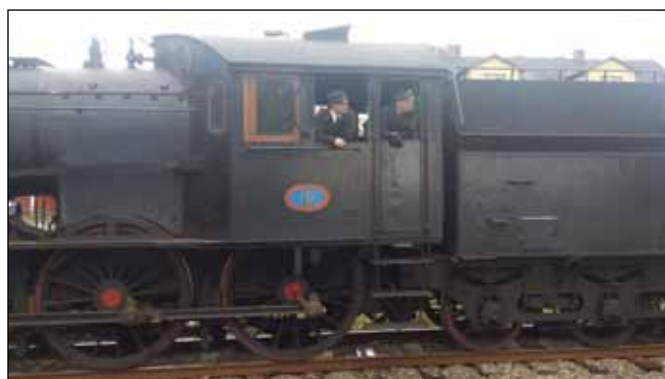
Personalen på ånglok; BJ 10.