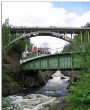
Första sidan; bild från Håverud, mötesplats för kommunikationer. Vad passar bättre än att mötas här på arbetslivsmuseernas Dag, se sid 4.