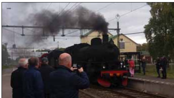
Ångloken blev till stora fotoobjekt.